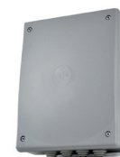
Q80A/Q20A Central eletrônica e recetor 433.92 MHz

Control board integrated with plug-in radio receiver 433.92 MHz