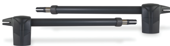
ASTER NEW Jogo de motores e acessórios de montagem